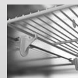
Standardní uchycení roštů