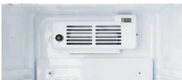
▼ digitální teploměr