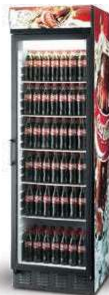
▼ FKG 410 – ukázka potisku