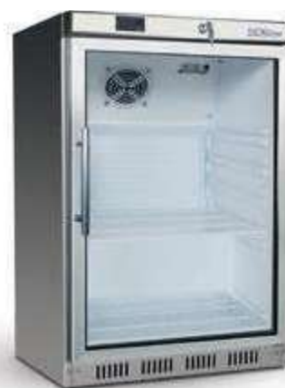
► UR 200 GS