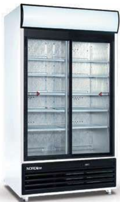
▼ USS 1000 DIKL