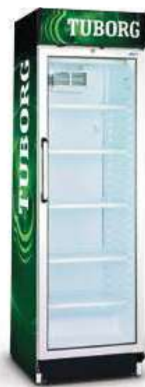
▼ ukázka reklamního potisku