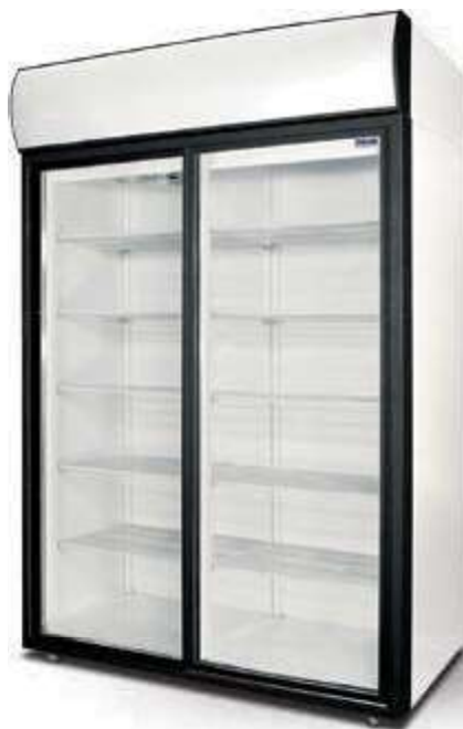
DM 114 SD