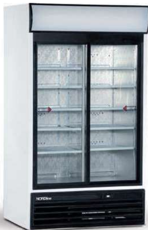
▼ USS 1200 DIKL