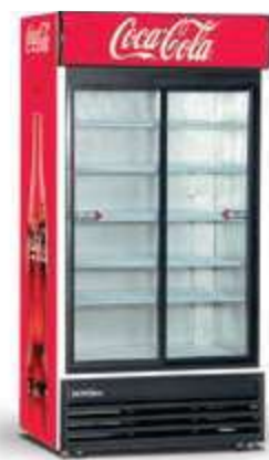
▼ ukázka reklamního potisku