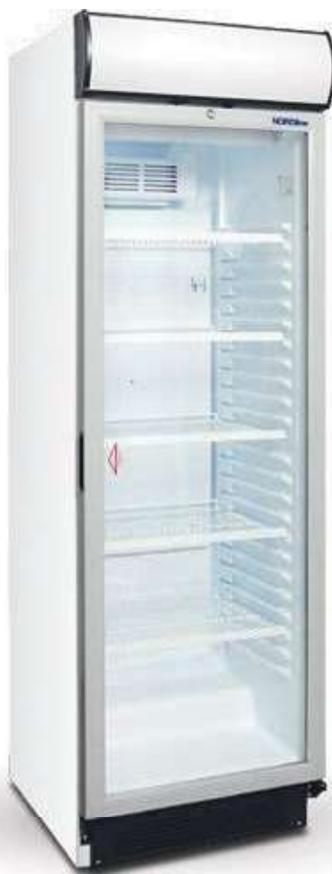
▼ USS 374 DTKLY