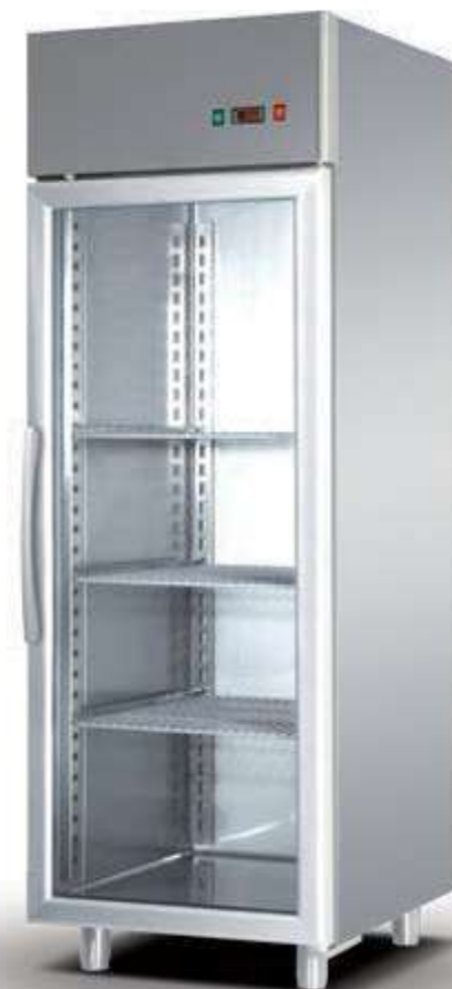
▼ TN 700 G