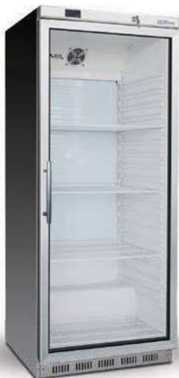
► UR 600 GS