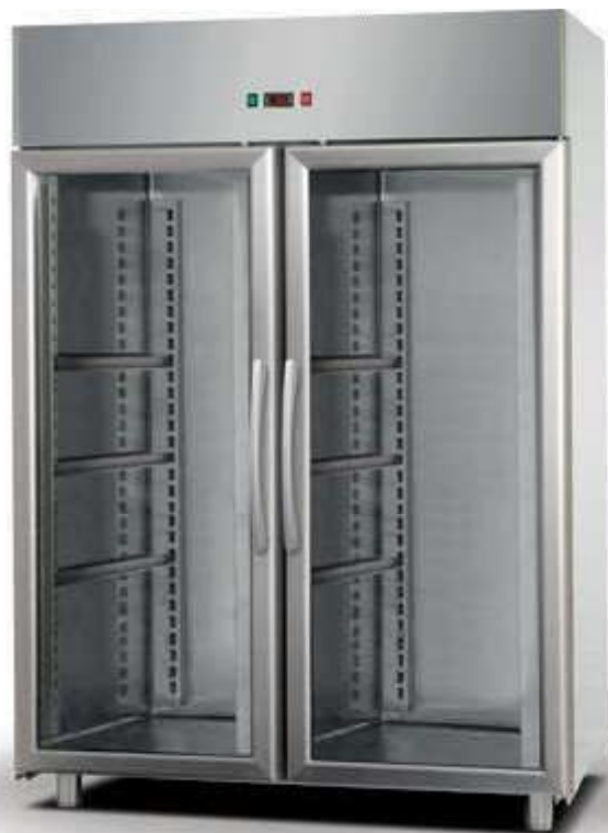
▼ TN 1400 G