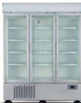
▼ USS 1600 DIKL