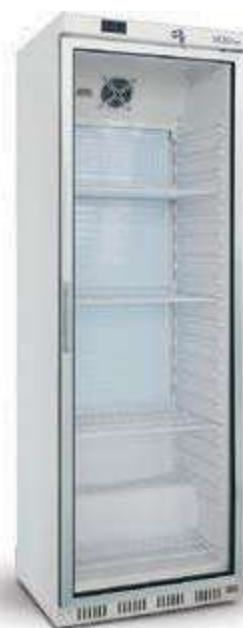
▼ UR 400 G