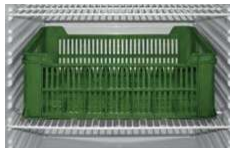
▼ do modelu UR 600 G lze vložit přepravku